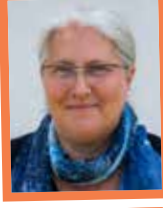
Dr. Ute Buth Impulse zum Umgang mit der eigenen Sexualität und der anderer